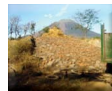
Silo de forraje abierto