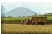
Cosecha de forraje

Con la promoción de esta estrategia en El Salvador y otras naciones centroamericanas han aumentado considerablemente la rentabilidad del cultivo de sorgo. Esto ha permitido que estos países minimicen importaciones de maíz costoso y ha mejorado considerablemente el estado alimenticio y económico de muchos agricultores minifundistas.