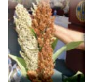
Alimento y Comida