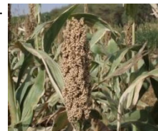
Photo 2 : Panicule de SSD-35 non endommagée par la cécidomyie, Konni, 2008.

Le processus de développement a débuté en 1999 par le croisement de la Mota Maradi (une variété de sorgho améliorée très précoce du Niger) avec la ICSV 88032 (une variété de sorgho résistante à la cécidomyie développée par l'ICRISAT). Cela a été fait par l'application de la méthodologie du "Single Seed Descent breeding" (initiée par le programme de sélection sorgho de l'INRAN) afin de sélectionner les variétés prometteuses et résistantes à la cécidomyie (Amadou, 1999). En Station, la technique de cage (Sharma et al., 1992) a été utilisée pour cribler les lignées issues des croisements et avancements pour déterminer celles qui sont résistantes à la cécidomyie. A la suite des essais avancés, la variété SSD-35 et SSD-33 se sont révélées résistantes à la cécidomyie. En milieu paysan, cette même technique de cage a servi de support technique pour aider à convaincre les producteurs que les panicules vides sont causées par les dégâts de la cécidomyie (Kadi Kadi, 2002a). En protégeant les panicules (Kadi Kadi, 2002b), il est facile d'observer la différence entre les panicules endommagées par la cécidomyie en comparant avec les panicules saines (Photo 2).