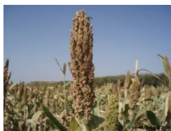
Photo 1 : Panicules de sorgho endommagées par la cécidomyie, Konni, 2008.

Le sorgho SSD-35 a été développé au Niger. L'objectif du développement de SSD-35 est de résoudre la contrainte d'attaque de la cécidomyie, Stenodiplosis sorghicola (Coquillet) qui est un insecte uniquement rencontré sur le sorgho et cause des dégâts très importants sur les panicules en floraison. La cécidomyie cause plus de dégâts sur les variétés tardives qui développent une mauvaise formation des grains de l'ordre de 50% (Photo 1). Parmi toutes les méthodes de lutte préconisées ou recommandées pour lutter contre la cécidomyie beaucoup sont impraticables, modérément efficaces ou coûteuses. La résistance variétale est la mieux recommandée car elle est peu coûteuse pour le producteur (Sharma et al, 1992). L'utilisation des variétés résistantes ne nécessite aucun investissement dans le domaine de la lutte contre la cécidomyie.