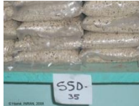
Semences de la SSD-35 (1 kg) en vente par l'Entreprise "Semencière Ahéri", Douchi, Niger, 2008