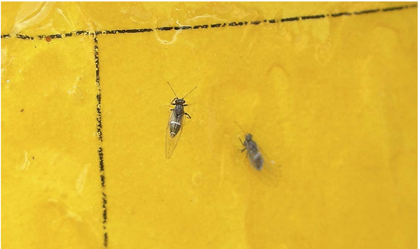
Ejemplares del Psílido de la papa pegados en una trampa.