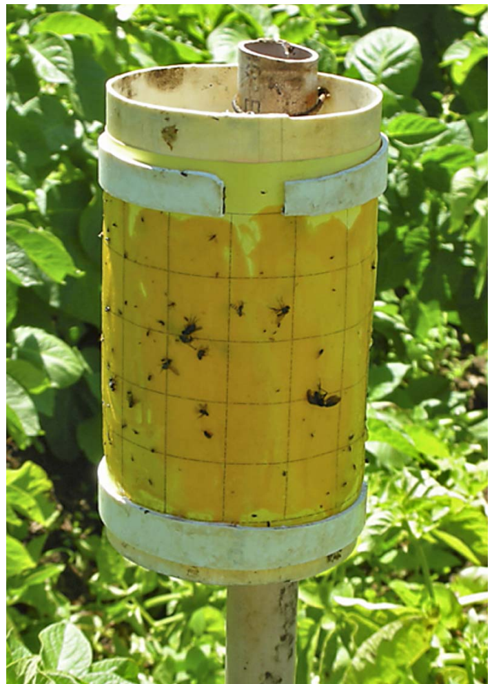
Trampa utilizada en el monitoreo.

Los adultos capturados fueron removidos de la trampa usando aceite de cítrico y colocados en frascos con alcohol al 70%. Estos especímenes fueron enviados al laboratorio de la Universidad de Arizona, Tucson, EE.UU., donde la Dra. Judith Brown los analiza para determinar la presencia de la bacteria Liberibacter solanacearum .